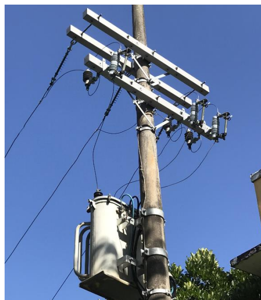
Depois da Adequação