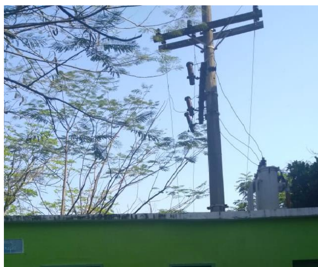
Antes da Adequação

Em vistoria técnica à Creche Pequenos Grumetes, realizada pela Assessoria de Engenharia e Meio Ambiente da Base de Hidrografia da Marinha em Niterói, para verificação da situação da Subestação Simplificada do local, foi constatado a necessidade de adequação à Norma Técnica NBR 15688:2012, que padroniza as estruturas para redes de distribuição aérea, e a Especificação Técnica nº 268 da Enel, que dispõe sobre o fornecimento de energia elétrica em tensão primária. Foram realizadas adequações, por empresa especializada, para atendimento às normas. As modificações consistiram em instalar dispositivos de proteção, substituir equipamentos obsoletos, além da fixação do transformador no poste, respeitando a altura mínima normatizada. As adequações foram realizadas com o intuito de garantir segurança e continuidade no serviço de fornecimento de energia.